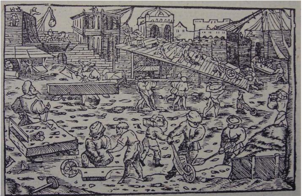
Ilis emprens quater maletgs secattan ella cronica da Johannes Stumpf da 1541. Ei setracta d'entagls en lenn.