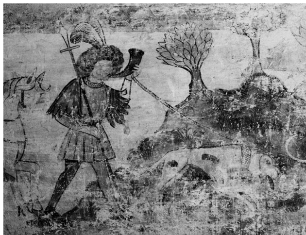
Pictura murala el "Stoffelhaus" a Farschno/Fürstenau