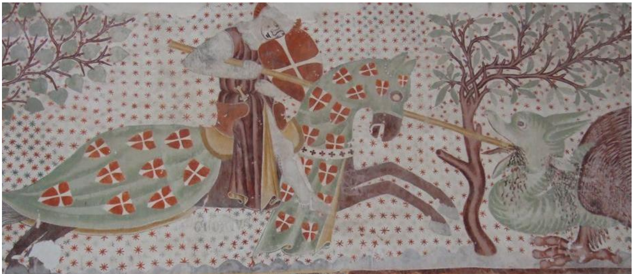
Pictura murala en baselgia da sogn Gieri a Razén